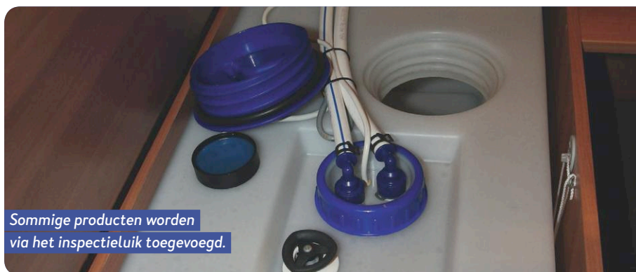
Sommige producten worden via het inspectieluik toegevoegd.