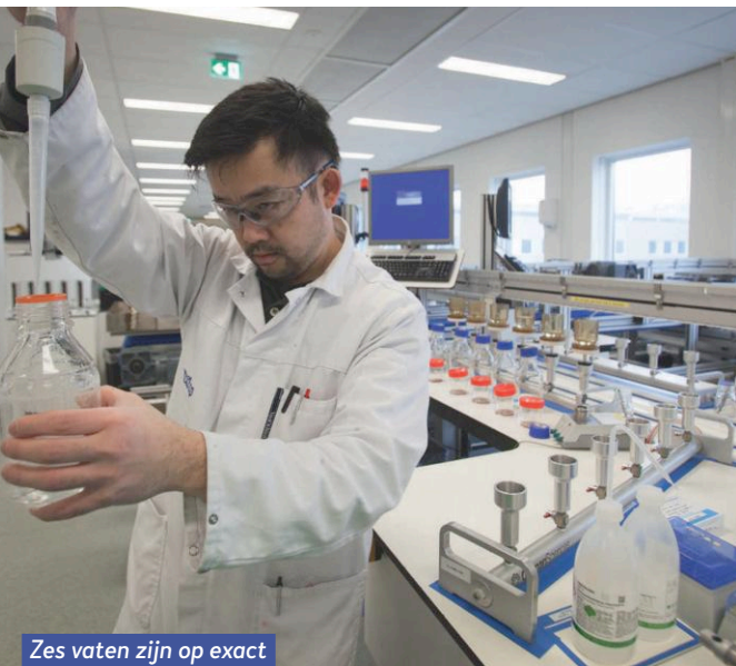
Zes vaten zijn op exact dezelfde manier getest.